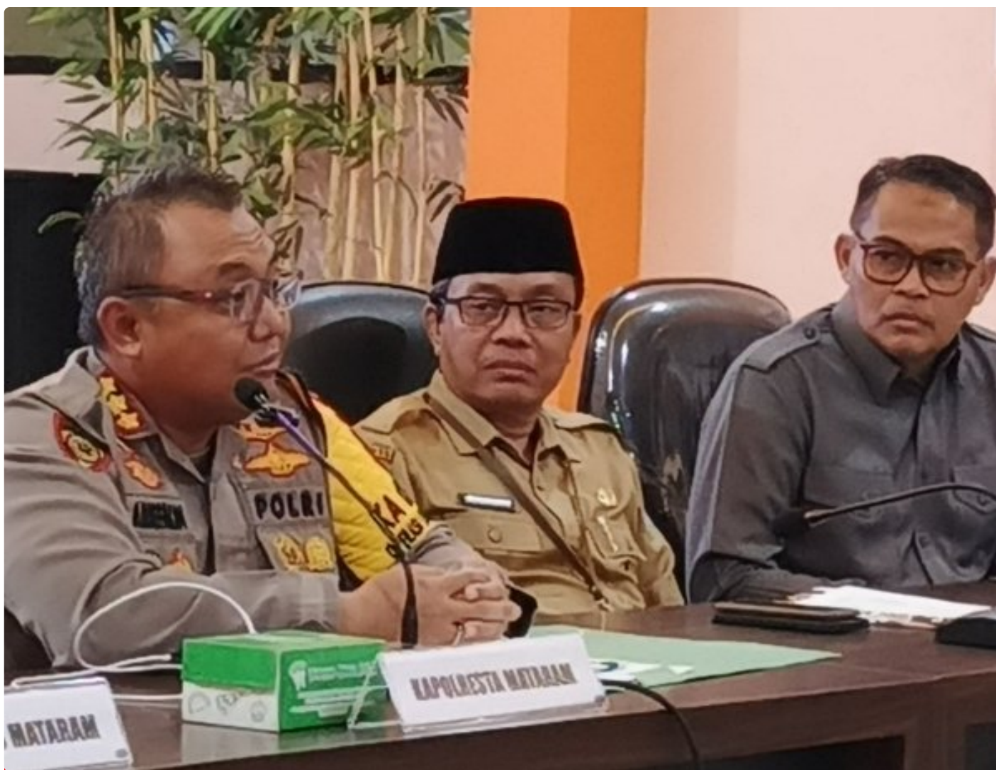
Kapolresta Mataram (Kiri) saat memimpin Konferensi pers akhir tahun, Selagi (31/12/2024)